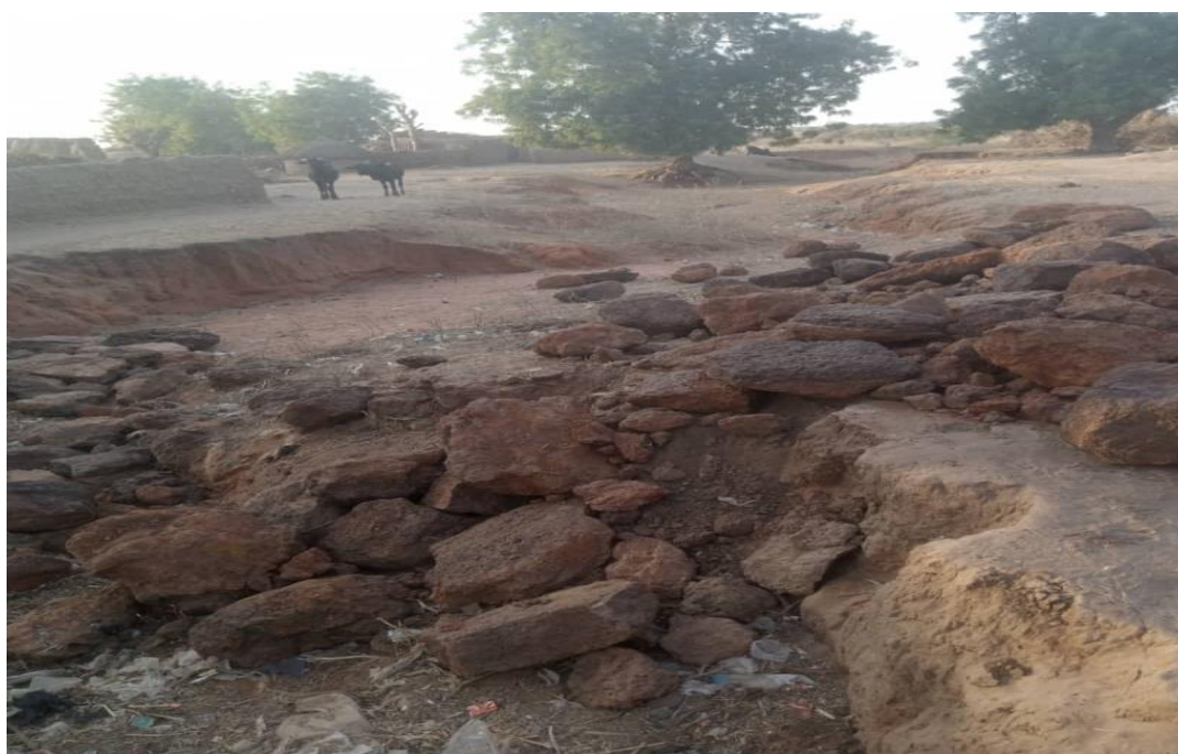
Vue d'ensemble d'un ravine en plein centre du village de Guidan Gaba dans la zone 2.

Les effets des changements climatiques ont significativement modifié la physionomie des sols. Cela se traduit par l'apparition de risques climatiques comme le ravinement des terres, les vents violents etc.